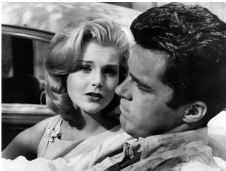
1963 LES LOUPS ET L'AGNEAU (The Stripper) de Franklin J. Schaffner avec Richard Beymer