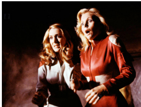
1979 ALERTE DANS LE COSMOS (The Shape of Things to come) de G. McCowan avec Anne-Marie. Martin