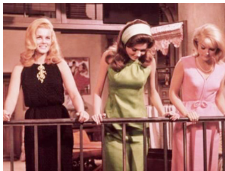
1964 TROIS FILLES À MADRID (The Pleasure Seekers) de Jean Negulesco avec Ann-Margret, Pamela Tiffin