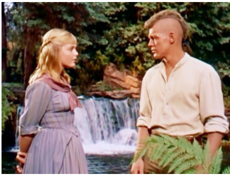
1958 LUEUR DANS LA FORÊT (The Light in the Forest) d'Herschel Daugherty avec James McArthur