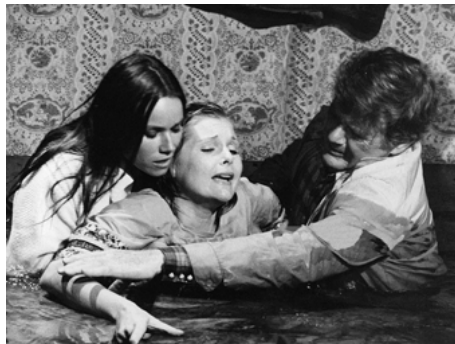
1976 DÉLUGE DANS LA VILLE (Flood) d'Earl Bellamy avec Barbara Hershey, Robert Culp