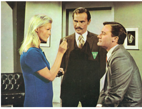
1968 ESPIONS EN HÉLICOPTÈRE (The Helicoptere Spies) de Boris Sagal avec Bradford Dillman, Robert Vaughn