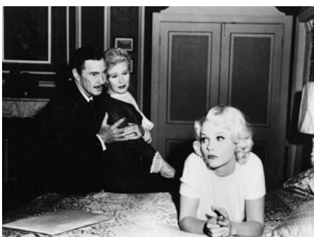
1965 HARLOW (Harlow) d'Alex Segal avec Efrem Zimbalist Jr, Ginger Rogers