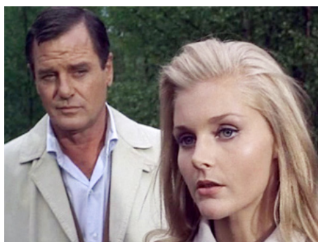
1967 LA MALÉDICTION DES WHATELEY (The Shuttered Room) de D. Greene avec Gig Young