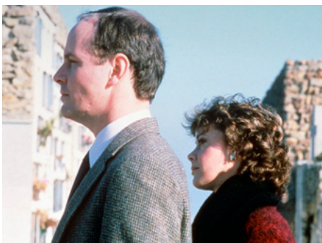
1989 LA TOUR NOIRE (Dark Tower) de Freddie Francis avec Michael Moriarty