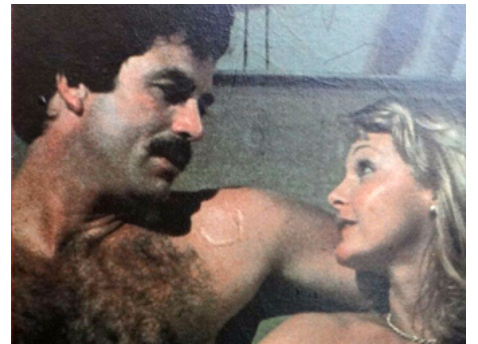
1977 L'AFFAIRE WASHINGTON (The Washington Affair) de Victor Stoloff avec Tom Selleck