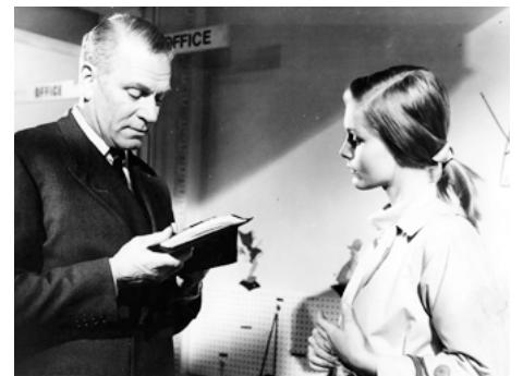
1965 BUNNY LAKE A DISPARU (Bunny Lake is missing) d'Otto Preminger avec Laurence Olivier