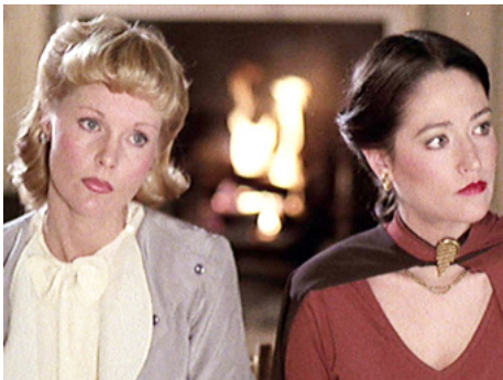
1979 LE CHAT ET LE CANARI (The Cat and the Canary) de Radley Metzger avec Olivia Hussey