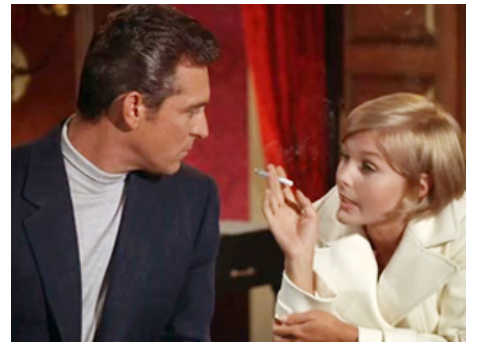
1969 HISTOIRE D'UN MEURTRE (Once you kiss a Stranger) de Robert Sparr avec Paul Burke