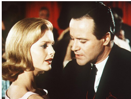
1963 OUI OU NON AVANT LE MARIAGE (Under the Yum Yum Tree) de David Swift avec Jack Lemmon