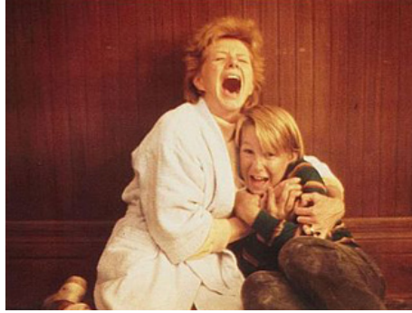
1972 ATTENTION AU BLOB ! (Beware, the Blob) de Larry Hagman avec Cindy Williams