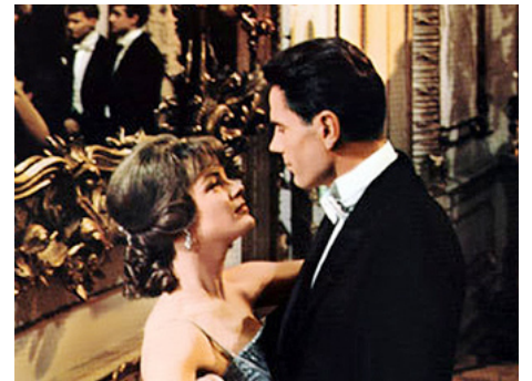
1963 LE CARDINAL (The Cardinal) d'Otto Preminger avec Tom Tryon