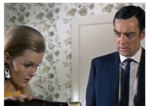
1967 LE COUP DU LAPIN (Danger Route) de Seth Holt avec Richard Johnson