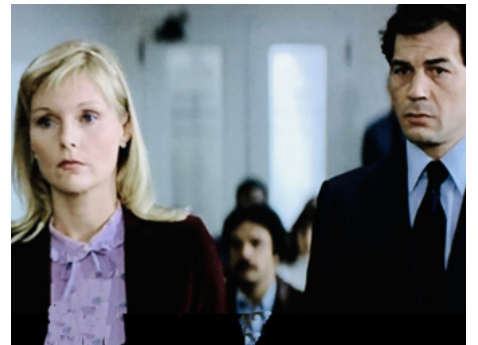
1983 VIGILANTE (Street Gang) de William Lustig avec Robert Forster