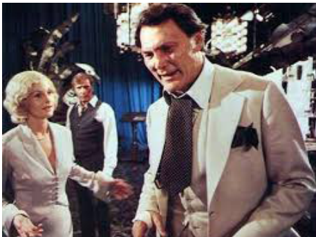
1975 THE FOUR DEUCES de William H. Bushnell avec Jack Palance