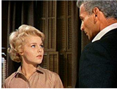
1961 LES LAURIERS SONT COUPÉS (Return to Peyton Place) de José Ferrer avec Jeff Chandler