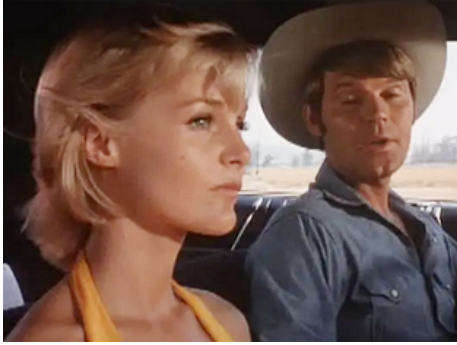
1970 NORWOOD (Norwood) de Jack Haley Jr avec Glen Campbell