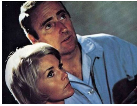
1969 THE MALTESE BIPPY de Norman Panama avec Dick Martin