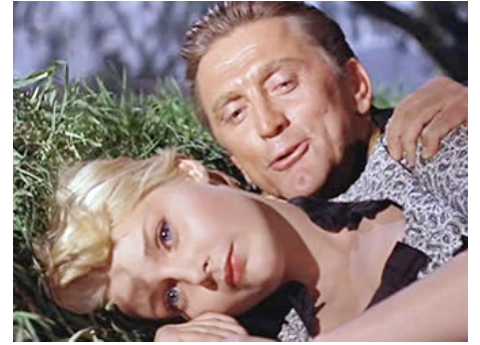
1961 EL PERDIDO (The last Sunset) de Robert Aldrich avec Kirk Douglas