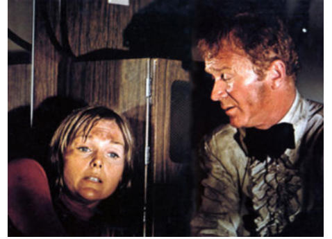
1972 L'AVENTURE DU POSÉIDON (The Poseidon Adventure) de Ronald Neame avec Red Buttons